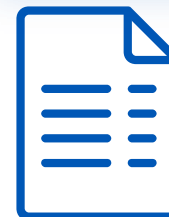
Схема направления заявок на перевод и обосновывающих документов в уполномоченный банк